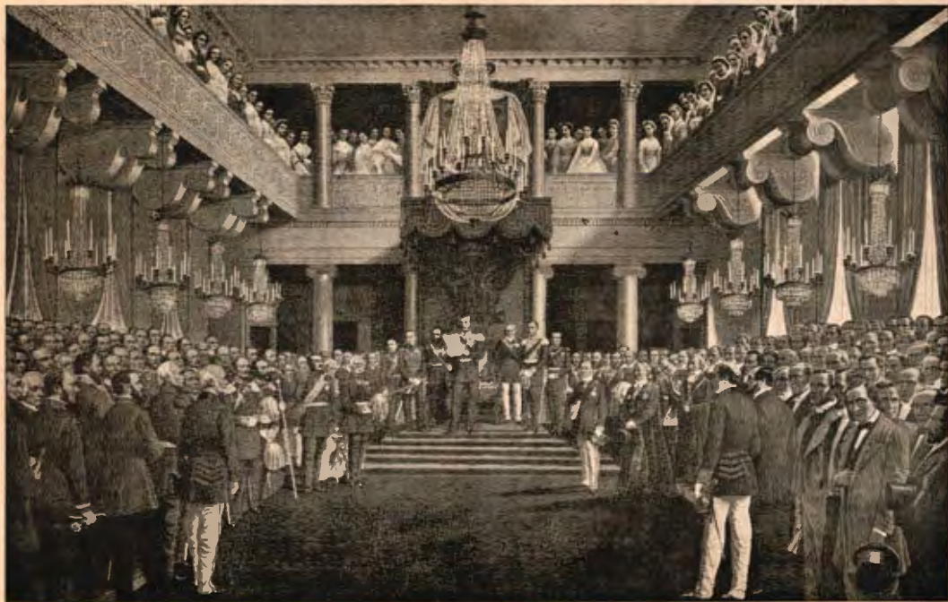
Valtiopäiväin juhlalliset avajaiset 18 p. syysk. 1863.