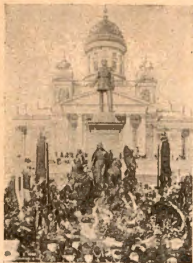
Aleksanteri II:n muistopatsas kukitettuna kevättalvella 1899, ympärille ikäänkuin pyhiinvaelluspaikkaan lmaisemaan

huolestumistaan ja lujaa uskoaan paremmasta tulevaisuudesta. Puheita ei pidetty; ainoastaan laulu ja kukat olivat tunteitten tulkkina. Mutta mitä silloin ajateltiin ja tunnettiin, se tuli välittömämmin ilmoille kuin milloinkaan muulloin sitä ennen.