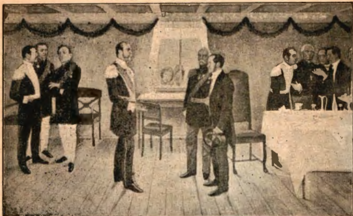
J. V. Snellman esitellään Aleksanteri II:selle Parolan leirillä.

lyhyesti, jonka johdosta keisari ihmetteli, miksi puhe venäjäksi meni niin paljon pikemmin. Kuultuaan, että sitä oli lyhennetty, kehoitti hän puhujan jättämään itselleen puheen kirjoitettuna.