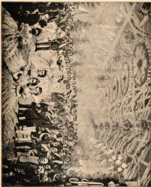
Valtiopäivätanssaiset Helsingin aseman hallissa.

tis, terve, jalo ja suloinen. Että tällä päivällä todellakin se merkitys on, todistaa Hänen Majesteettinsa valtio-