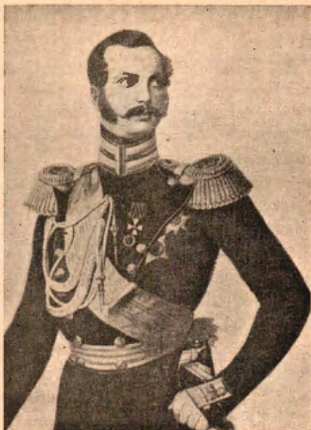
Aleksanteri II yliopiston kanslerina.

lausuttua siitä kiitollisuutensa esitti yliopiston rehtori useita uusia yliopiston rakennusten lisäys- ja laajennussuunnitelmia, jotka heti kohta saivat konsistorin ja kanslerin hyväksymisen. Kun vielä joukko asioita oli käsitelty, lausui kansleri tyytyväisyytensä yliopistoon.