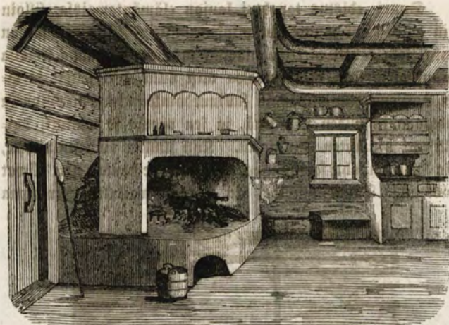
Tupa uunineen Hirwofsen kylästä Marttilasfa.

Myöhempinä aikoina vielä on kiukaasen lisätty hella. Siitä kyllä on hyötynä ruoan keittämisesä ja tulee lämmitysaineiden säästöä. Mutta on vastustakin: Kun pellit vedetään kiinni, tosin lämmin pysyy, mutta sen ohessa jää huoneesen kaikki ruoan haiku ja kosteus, joka ennen lähti ulos piipusta tai räppänästä sawun kanssa, ja huone ei ainoastaan käy asujille vastenmieliseksi, waan kosteus myöskin mädäntää seinät; sentähden onkin monessa paikoin jo tuwan wiereen rakennettu eriyhinen kyökki ruoan keittoa warten.