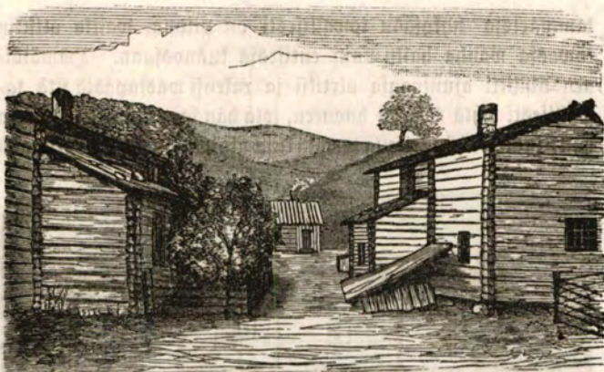
Kahden talon väli Portaan kylästä Tammelan pitäjää.

aitta tai laskeettava huone tai potaattikellari samaan porstuaan muiden huoneiden kanssa, uvan kylkeen lisättiin yksi tai kaksi kammaria ja siten pian syntyivät koko monihuoneiset rakennukset. Mutta tämä rakennustawan edistyminen sai aikaan tärkeän muorovaiikutuksen kansan elämään sekä hyvään että pahaan päin.