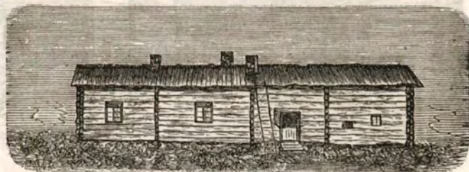
Talo Uutilan kylästä Kärkölan pitäjää.

kammariensa nykyään tavallisesti on piippu, vaikka olisikin tuossa vanha haiku-uuni entisessä kunnossaan. Hämäläinen nimitti asuntoansa pirtiksi ja rakensi vastapäätä sitä, tavallisesti yhtä leveään huoneen, jota hän sanoi tuwaksi ja jonka hän sifusti vähän toisella tavoin kuin asuinhuoneensa. Toisinaan