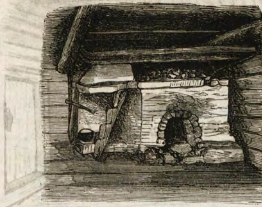
Pirtin uuni Kärkölästä.

Tämä kuva on merkittävä senkin tähden että siinä nähdään, mitä varustuksia asuinhuoneissa oli kylpyä varten siihen aikaan, jolloin Hämeen pirttejä vielä käytettiin saunoina. Uunin kylkeen on asetettu vanhan-aikaiset pykäläportaat, joilla kävi astuminen ylös, ja orteen uunin yli on kiinnitetty kaffi kähräkki wäännettyä lautaa, joidenka toiset päät ovat seinään