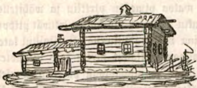
Tupa ja kammari Jääskestä.

Alkuansa oliwat talollisen waatimukset niin supistetut että hän tyytyi asuntoon, jota senlisäkfi, että se antoi suojaa hänelle itselleen, myöskin käytettiin saunana ja riihenä. Suomen kaffi pääheimoa Hämäläiset ja Sawolarjalaiset eroawat toisistansa juuri tawassa, jolla tästä alusta lähtien kehittiwät asuntojaan. Hämäläiset erottiwat aikaiseen riihen, warustiwat sen lakalla ja permannolla, mutta pitiwät saunan ja pirtin kauan yhtenä sikfi, kunnes wihdoin muuttiwat pois saunasta piippu-uunilla warustettuun tupaan. Sawolaiset aikaisemmin rakensiwat eri saunan, pienen, waiwaisen Hämäläisen saunaan verraten ja aiwan toisenmuotoisella lawalla warustetun; samoin hekin rakensiwat eri riihen ilman lakkaa ja usein ilman laattiaakin ja itse jäiwät asumaan wanhaan haiku-uunilla warustettuun tupaansa, jonka räppänän he muuttiwat seinästä lakeen ja jota sentähden Sawossa nimitetään lakeisekfi. Tämä oli kuitenkin ainoastaan edistykseen alku. Toinen aste oli asuinhuoneiden lisääntyminen.