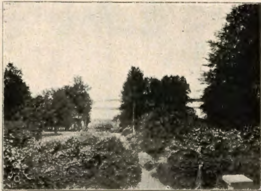
Näköala Liuksialasta Roineelle.

Kieltämättä Liuksialan niissä oloissa kohonnut varallisuuskin oli juuri toimeliaan ja uutteran emännän ansiota. Hän oli noita entisajan voimakasluonteisia