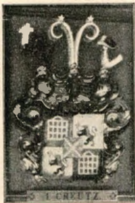
Creutzin suvun vaakuna.