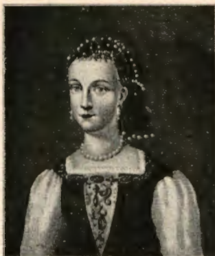
Sigrid Vaasa. Kangasalan kirkossa olevasta maalauksesta.

mainittuihin oikeuksiinsa, minkä kuningas 1594 myönsi. Lahjoitus sisälsi Liuksialan kartanon etuinensa ja 75 sen ympärillä olevaa verotaloa Kangasalan ja Pirkkalan pitäjissä.