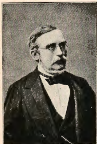
Agaton Meurman 1882.

Tämä pitkäaikainen luottamustoimi aiheutti, niin kuin edellä on mainittu, hänen muuttonsa perheineen Helsinkiin. Vastenmielisesti muutti hän rakkaasta rauhaisasta Liuksialastaan meluavaan Helsinkiin, ja varmaan eli hän onnellisimmat ja tuloksiin katsoen hyödyllisimmät vuotensa — parhaan, työkykyisen miehuutensa — Liuksialassa, jonne hän perheineen sittemmin aina kesäksi palasi. Silloinkos taas hiljaiseen ja autioon Liuksialaan tuli elämää ja liikettä.