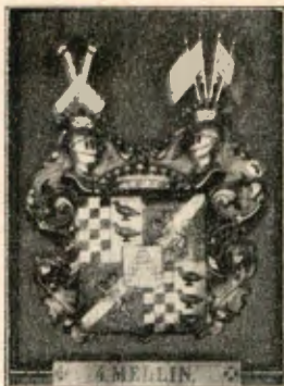
Mellinin suvun vaakuna.