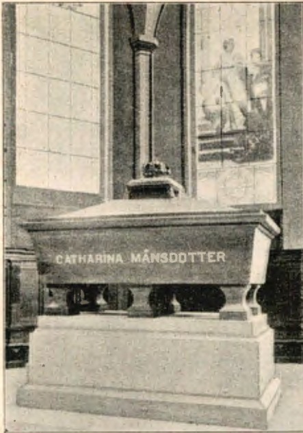
Kaarina Maununtytären hauta Turun tuomiokirkossa.

rettiin Hornien (Kankaisten) hautakuorista erotettuun ja varta vasten aistikkaasti laitettuun ja koristettuun osastoon. Siellä lepää yksinkertaisessa, mustassa marmoriarkussaan Kaarina-kuningatar, ainoa kruunattu hen-