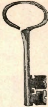
Liuksialan kirkon avain.

sialan kirkko käyttämättä. Luultavasti se pian kokonaan hävitettiin, kun se oli keskellä kartanon peltoa. Olivatpa omistajat aikoinaan valittaneetkin kirkkoväen sotkevan peltoja. Liuksialassa säilytetään vielä isoa rautaista avainta, jonka taru kertoo olleen entisen L:n kirkon avaimen. Nykyisessä kirkossa on vielä joitakuuta keskiaikaisia, kömpelösti tehtyjä, puisia veistokuvia, jotka lienevät vanhan kirkon peruja. Taru kertoo noiden veistokuvien muka saaneen määrätä nykyisen kirkon paikankin. Ne kannettiin lähellä olevaan Kirkkojärveen ja minne tuuli ja laineet ne kuljettivat, sinne päätettiin uusi kirkko rakentaa. Osa noista veistokuvista on lahjoitettu kansallismuseoon, osa on mädäntynyt kirkon kosteassa kellarissa.