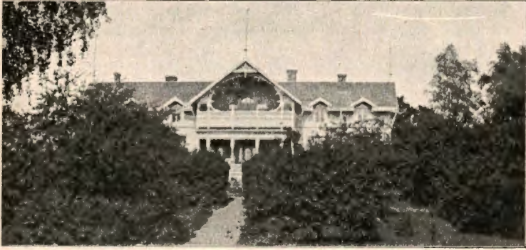
Liuksiala Roineen puolelta. Nykyinen päärakennus.